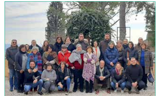
Corso gennaio 2023

Al corso posso partecipare tutti coloro che si sentono interessati a questa tematica con una condizione essenziale: aver partecipato alla prima parte del Corso sul Discernimento.