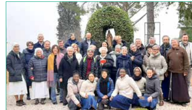
Corso febbraio 2023

Al corso posso partecipare tutti coloro che si sentono interessati a questa tematica con una condizione essenziale: aver già avuto esperienza degli esercizi ignaziani negli EVQ o nella Scuola di Preghiera Ignaziana o negli Esercizi Spiritual Ignaziani.