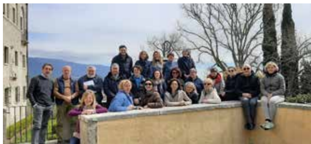
Esercizi per professionisti aprile 2023

Sulla strada verso Emmaus il Risorto incontrerà anche ciascuno di noi e farà ardere il nostro cuore assetato di tenerezza.